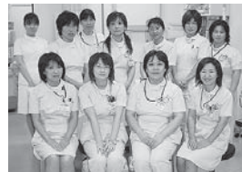
10月から、来では昨年